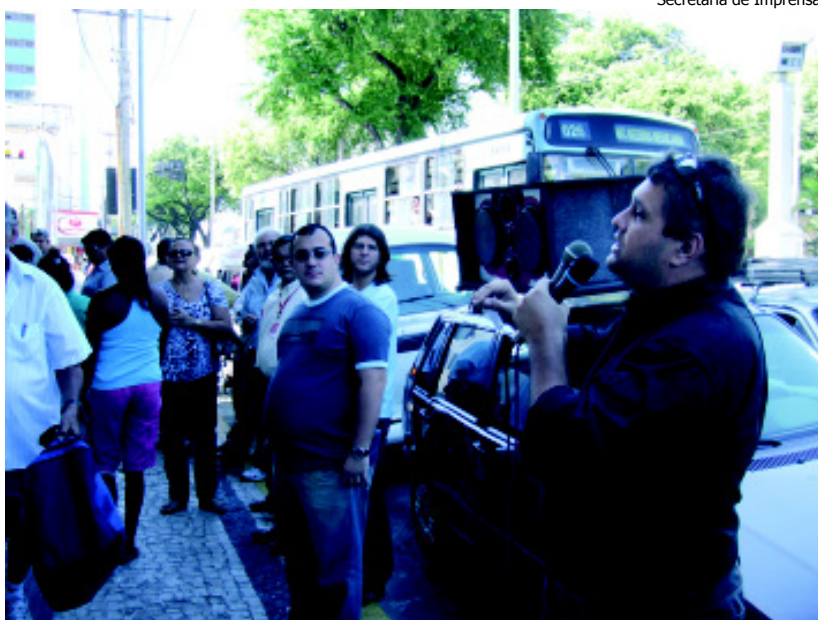
Secretaria de Imprensa

Os sindicatos dos Bancários e dos Vigilantes fizeram ato conjunto cobrando mais segurança nas agências