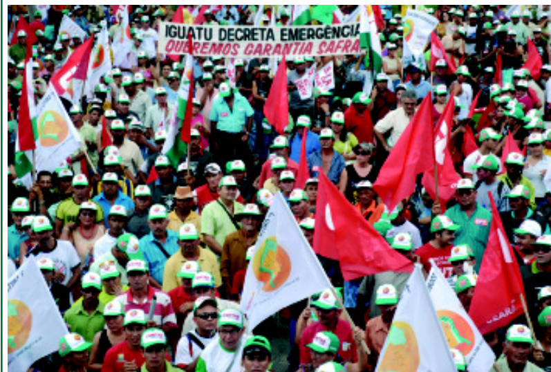
Os trabalhadores rurais se concentraram na praça do 5º BPM e saíram em passeata pelo Centro da cidade, com destino ao BNB e DNOCS