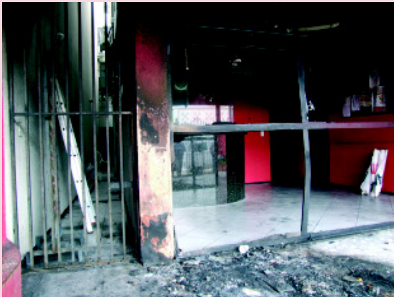
A entrada da sede do Sindicato ficou parcialmente destruída após o atentado