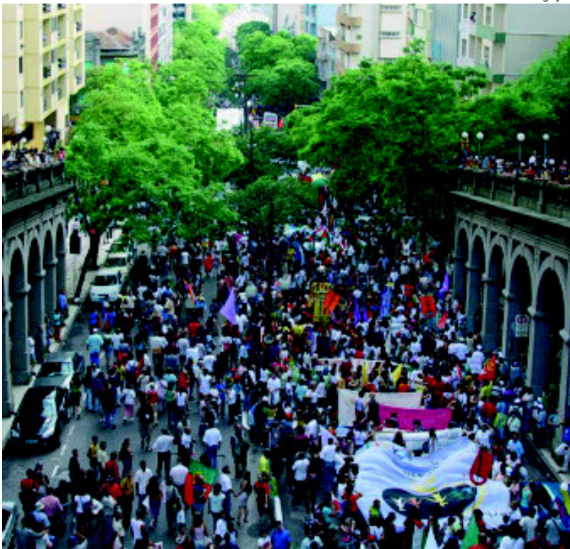
Essa é a nona edição do Fórum Social Mundial e a quinta realizada no Brasil

Considerado o principal contraponto ao Fórum Econômico Mundial, que aconteceu paralelamente em Davos, na Suíça, o FSM não concentrou a discussão apenas sobre a crise financeira internacional. Também estiveram na ordem do dia as crises ambiental e de segurança alimentar, que justificam inclusive a escolha de uma sede amazônica para o Fórum.