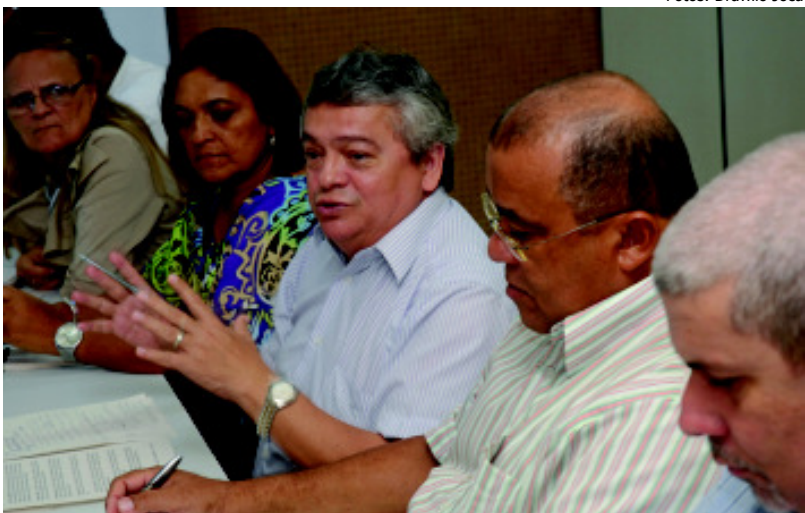
A reunião da mesa permanente aconteceu no dia 15/7, no Passaré

PASSIVOS – O Banco informou que está se organizando internamente para discutir os passivos trabalhistas em todos os estados onde há esse problema. No Ceará, há dois passivos em fase final de execução