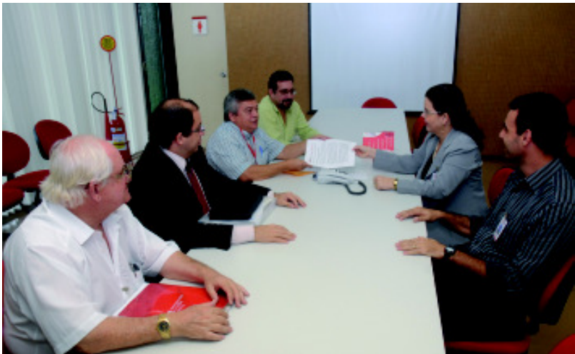
No dia 17/7, o GT da Ação de Equiparação entregou ao banco sua posição oficial sobre a base de cálculo

– a ação de equiparação das funções do BNB às do BB e a licença-prêmio. Na sexta-feira, dia 17/7, o Sindicato entregou ao Banco sua posição oficial sobre as verbas remuneratórias que devem compor a base de cálculos da ação. Quanto à licença-prêmio, o SEEB/CE deve apresentar, na próxima semana, uma contraproposta baseada em consulta ao funcionalismo realizada durante toda a semana que passou.