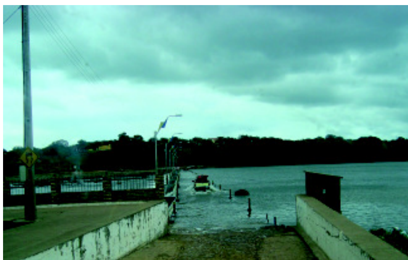
No dia da entrega dos donativos, 10/7, o acesso à localidade de Logradouro, em Itaíçaba, ainda era muito difícil