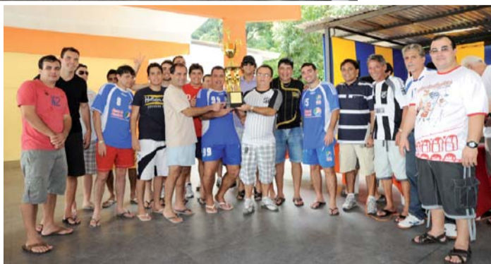
Equipe do BNB recebe premiação de segundo colocado